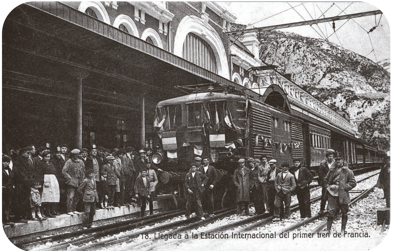
18. Llegada a la Estación Internacional del primer tren de Francia.

Primer tren francés.